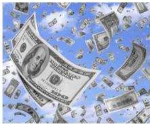
Cuando aumente la renta per cápita .